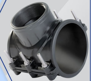
کمر بند Clamp Saddle