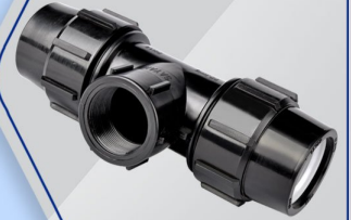
سه راه ماده Female Tee