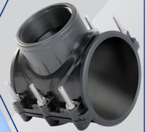
کمر بند Clamp Saddle