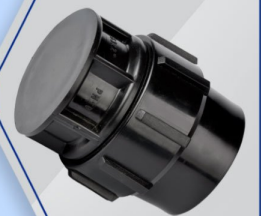
درپوش کور End Cap