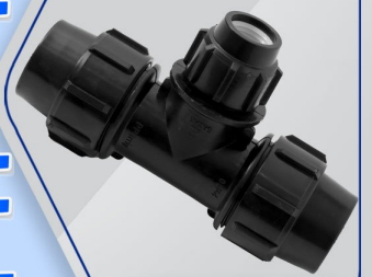
سه راه تبدیلی Reducing Tee