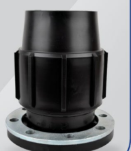
اتصال فلنج دار Flanged Adapter